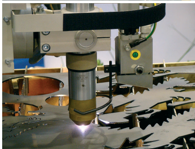
fol. Expo Silesia