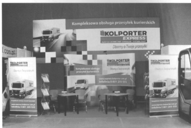
Nowa usługa spółki Kolporter SA