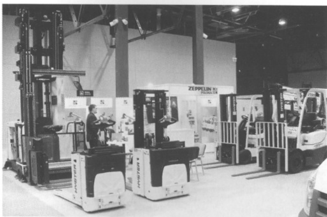
Zepellin Polska – dystrybutor wózków widłowych marki Hyster

Tendencje rynku samochodów dostawczych pokazują wyraźnie, że imprezy wystawiennicze nie tylko nie tracą na znaczeniu, ale cieszą się niesłabnącym zainteresowaniem odwiedzających. □