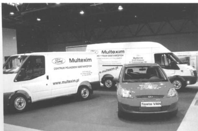
Ford Multexim zaprezentował 3 samochody

70 wystawców z 8 krajów Europy – Austrii, Belgii, Czech, Holandii, Litwy, Niemiec, Włoch oraz Polski – wzięło udział w 2. Międzynarodowych Targach Logistyki, Magazynowania i Transportu Logistex.